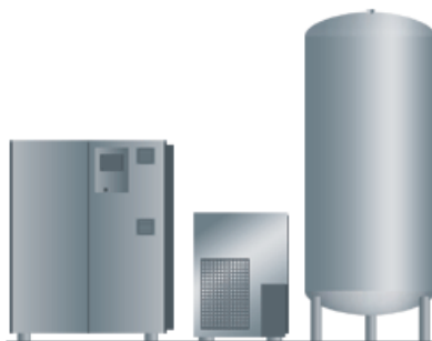
Компрессор + осушитель (С подготовкой воздуха)